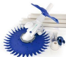
Limpiafondos automático Automatic cleaner 19007