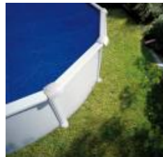
Cubierta isotérmica Isothermic cover CPROV610