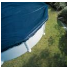
Cubierta de invierno Winter cover CIPROV611