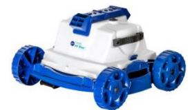
Robot Robot RKJ14