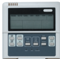
TRÅDBUNDEN STYRENHET KJR12B TILLVAL