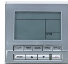
TRÅDBUNDEN STYRENHET KJR90A TILLVAL

FG Nordic Group, som består av FG Nordic AB och Svensk Kylimport AB (SKIAB), är en ledande leverantör av kyltekniska produkter och värmepumpar på den svenska marknaden med varumärken som Fujitsu, Fuji Electric, Clivet, MTA, Kaisai med flera i portföljen. Vi ingår i den internationella kyl- och ventilationskoncernen Klima-Therm med huvudkontor i Warszawa och verksamheter i USA, Polen, Skandinavien och Baltikum.