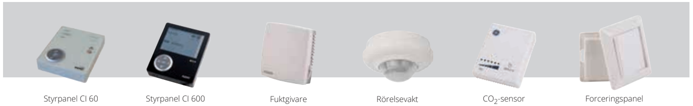
Styrpanel CI 60